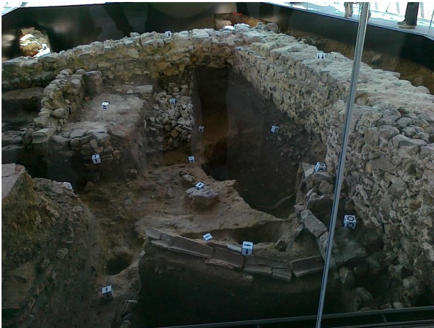
Wykopiska archeologiczne w Aachen