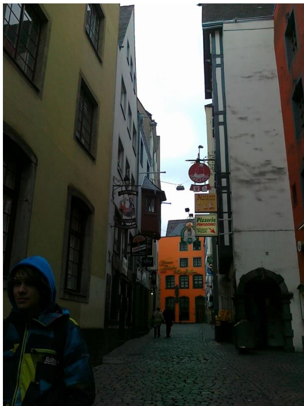
Staromiejskie uliczki w Kolonii